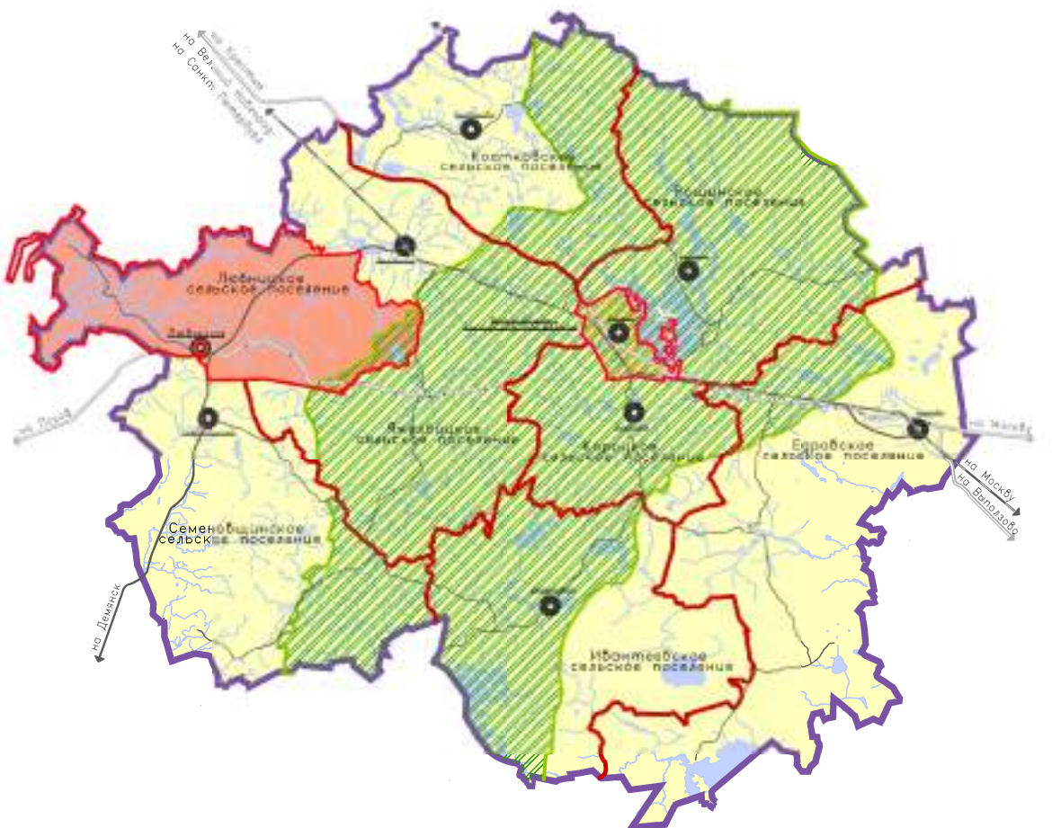
Схема расположения Любницкого сельского поселения в системе Валдайского муниципального района